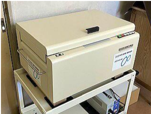
整備されたプリンター

また、大量のデータが高速で印刷されるため、資格取得などをめざす視覚障がい者の方々への情報提供も迅速に行えるようになり、障害を持つ学生の職場体験や実習などにも活かすことが期待されています。