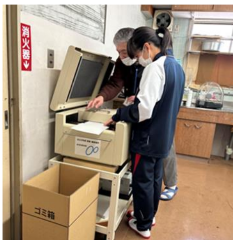
視覚支援学校生の 職場体験